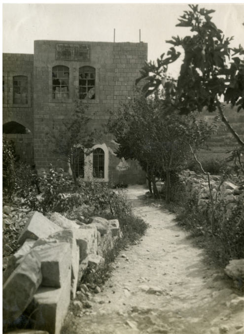
איור 5: מבנה הישיבה לאחר הפרעות – שימו לב לזוגיות השבורות ולשלט הדהוי ביחס לאיור מס' 2

שגופתו נשארה במקום. לאחר מכן הגיעו שני שוטרים רכובים, פיזרו את הערבים והשתרר שקט. משפחת הרב אהרן וצילה כהן עברו בליווי שוטרים לבית ראש הישיבה, אביה של צילה. בני הבית לא יצאו מביתם ואף לא הדליקו נרות שבת. את תפילות השבת והסעודה ערכו בבית. 18 היו אלה סימנים ברורים לאלימות הצפויה בחברון.