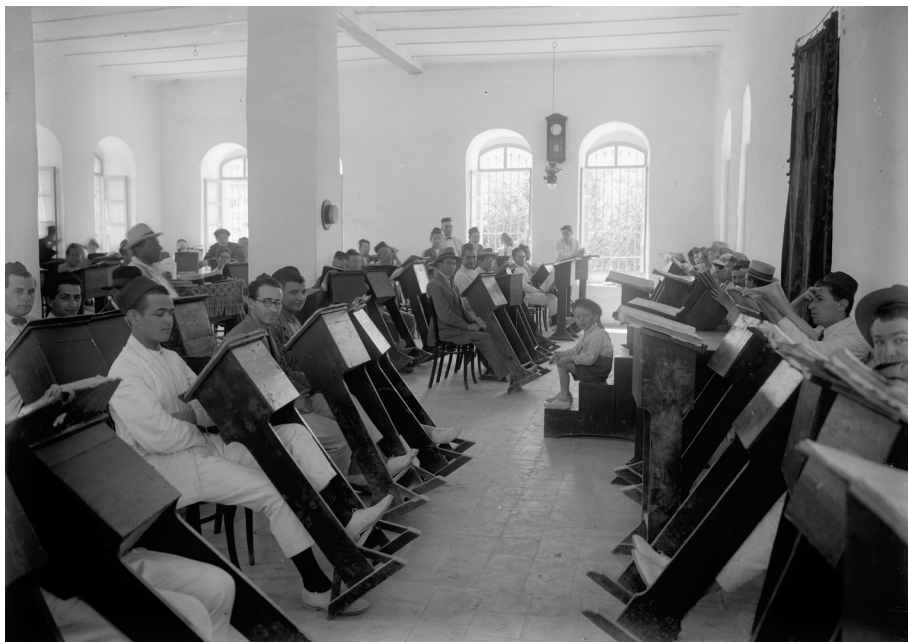
איור 3: חברון – המראה הפנימי של הישיבה