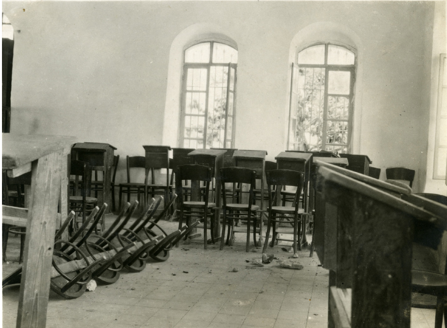
איור 4: אולם בית המדרש של ישיבת כנסת ישראל לאחר הפרעות

בנימין סוקולובסקי, שראה את ההמון תוקף את יוסף אקסלרוד. ההמון המשיך להתפרע ברחוב הראשי, ניפץ שמשות בבתי היהודים, ושם פעמיו לעבר הישיבה. השייח' עבד אל גפאר סהבוב הסית את ההמון להרוג את יהודים כנקמה על הריגת אחיהם המוסלמים בירושלים. ארבעה שוטרים שנכחו במקום לא ניסו להרגיע את ההמון. המתמיד שמואל רוזנהולץ ושמש הישיבה, זכריה משה מישאל, שהיו במקום סגרו את הדלת. התוקפים זרקו אבנים, שברו את השמשות, ואחר כך שברו את הדלת ונכנסו לאולם הישיבה. הם פצעו באבן את רוזנהולץ, שרץ החוצה, ושם נדקר למוות בידי שניים מהתוקפים. זכריה, שהיה בבית מול אולם הישיבה, הצליח להסתתר בתוך בור מים וניצל. הוא נשאר שם עד חצות, וכשהתברר לו שהסכנה חלפה הוא טיפס החוצה על צינור המשאבה. הפורעים שברו, ניתצו וקרעו כל אשר נקרה בדרכם בישיבה. כשיצאו מהישיבה הם קראו: "חבל שמצאנו רק יהודי אחד. אבל אין דבר, מחר נוסיף כהנה וכהנה". שמש הישיבה העיד בעת חקירתו של טאלב מרקה כי ראה בעיניו את רצח שמואל רוזנהולץ, שלמד באולם הישיבה. 16