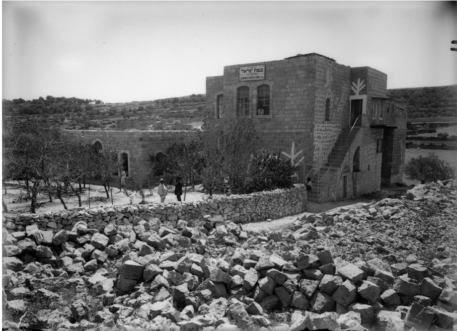
איור 2: חברון – הישיבה הסלובודקאית בחברון (צילום: צדוק בסן, ארכיון הצילומים של קק"ל, תמונה 15-043-Glass)

ענו לו שללא ספק הם יתגוננו. לשאלתו כיצד יעשו זאת, כיוון שהם אינם מאומנים, השיבו לו: "בעזרת ה'" (לובראני תשי"ח: 102). 4