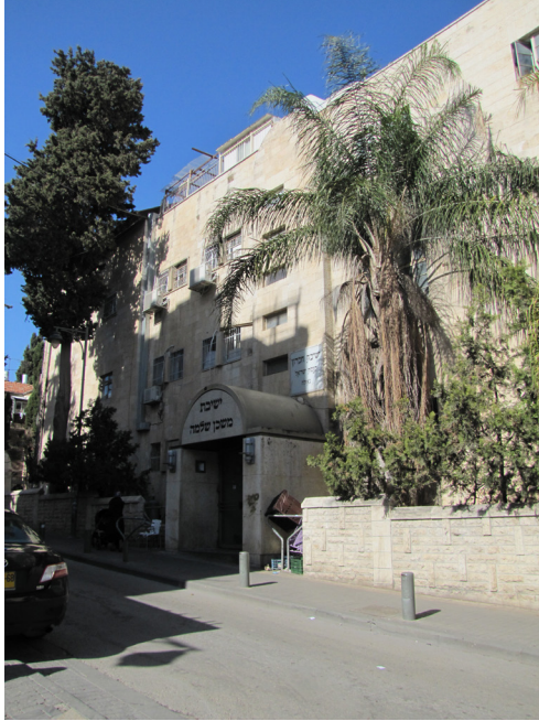
איור 8: מבנה ישיבת סלובודקה בשכונת גאולה בירושלים, לאחר המעבר מחברון

נמצאת בחברון כחמש שנים, ובמשך הזמן הזה לא קרה אף מקרה בלתי נעים אחד. לכן לא עלה על דעת אף אחד שיקרה מקרה כזה. 29