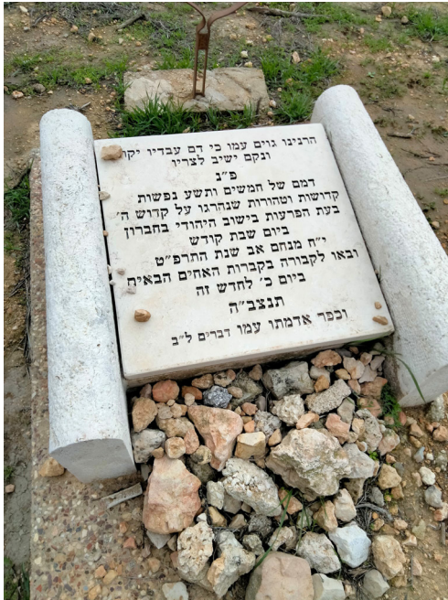
איור 9: לוח הנצחה בבית העלמין בחברון לחללי פרעות תרפ"ט

עם הקמת המדינה דיברו איתי על בחורי הישיבה אחד מגדולי