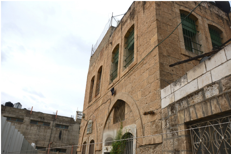
איור 7: מבנה ישיבת סלובודקה כיום, בלב העיר חברון

הטבח בחברון בכלל, ובישיבה בפרט, עורר תגובות בקרב חוגים שונים, שהתייחסו לחוסר היכולת של תלמידי הישיבה להגן על עצמם כראוי. ב־19 בנובמבר 1929 פרסם אחד מתלמידי הישיבה (בעילום שם) בעיתון 'דאר היום' מאמר שכתורתו "דעת הקהל על לומדי הישיבות":